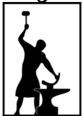
HACIENDA Los Herreros