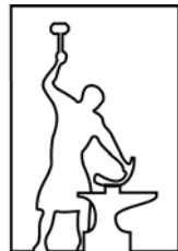
HACIENDA Los Herreros